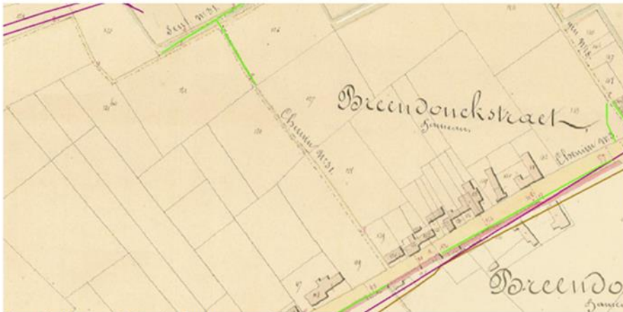
Figuur 1: Uittreksel Atlas der Buurtwegen - Provincie Antwerpen

Onderhavige aanvraag betreft de gedeeltelijke afschaffing van buurtweg nr. 31 op grondgebied van de gemeente Willebroek. Het betreft een insteekweg die de achterliggende percelen aansluit op de Breendonckstraat en waarvan reeds een gedeelte van buurtweg nr. 31 is afgeschaft (goedgekeurd door de Gemeenteraad dd. 29/11/1994 en de Deputatie dd. 14/12/1995, conform plan opgemaakt door landmeter J.L. Talboom dd. 08/08/1994).