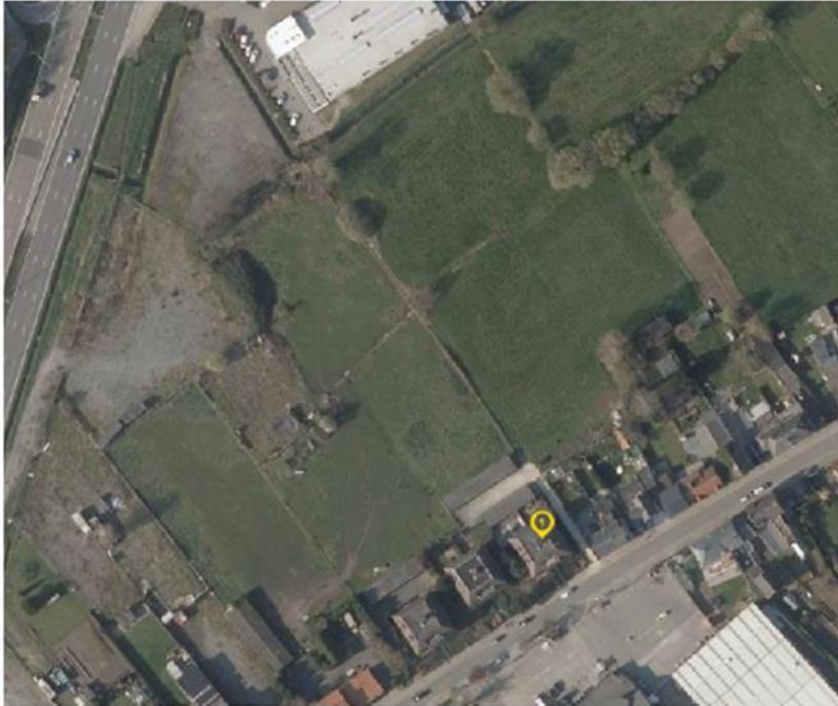
Figuur 10: Luchtfoto Geopunt

Aan de principes van artikel 4 van het geldende Gemeentewegendecreet kan als volgt worden voldaan: