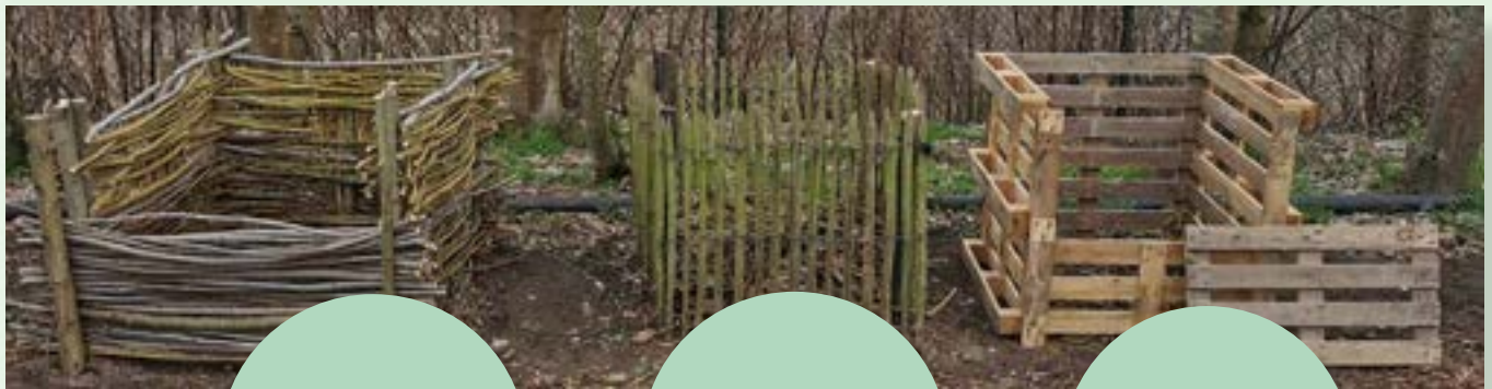
Compostbak van wilgentakken